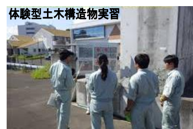
体験型土木構造物実習