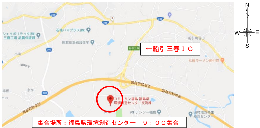
図-1 集合場所（福島県環境創造センター）